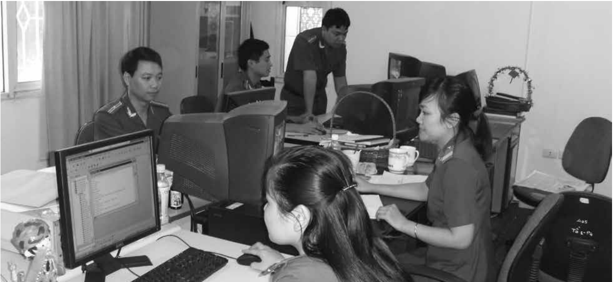
Một bộ phận cán bộ chiến sỹ nghiên cứu ứng dụng tin học (Phòng 5/ C53) thảo luận trực tuyến, hướng dẫn địa phương vận hành sao lưu dữ liệu