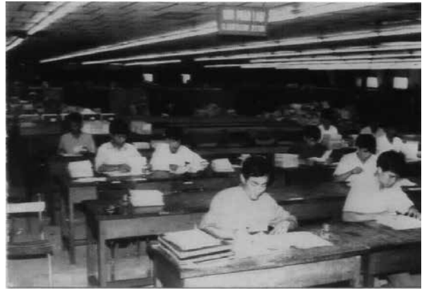
Phân loại, khai thác hồ sơ, tài liệu thu được của Mỹ - ngụy tại Sài Gòn (TP HCM) năm 1975

Năm 1975, trong chiến dịch Hồ Chí Minh, giải phóng miền Nam thống nhất đất nước, do có kinh nghiệm trong các lần thu giữ hồ sơ tài liệu của địch, Ban Bí thư Trung ương Đảng đã có chỉ thị cho các lực lượng vũ trang, các bộ, ngành, địa phương chủ động chuẩn bị lực lượng tại chỗ cùng các đoàn cán bộ từ miền Bắc chi viện vào, giải