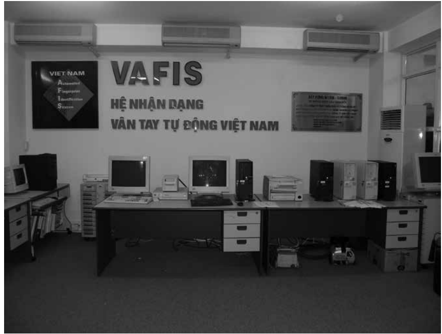
Hệ nhận dạng vân tay tự động Việt Nam- Vietnames automated fingerprint identification system (VAFIS) được triển khai do Phòng Nghiên Cứu ứng dụng Công nghệ thông tin quản lý từ năm 1996

2. Hai chiếc máy tính 286 đầu tiên: Đầu những năm 90, gọi là ứng dụng tin học nhưng lúc đó chỉ có lý thuyết, chưa có công cụ, phương tiện mà yêu cầu tối thiểu cũng phải có vài cái máy tính. Thấy mấy cán bộ tin học hồi ấy toàn viết vẽ các sơ đồ, ô vuông, ô tròn, mũi tên một chiều, hai chiều, vạch nối liên kết, phân cấp các khối thông tin với nhau; họ gọi là tìm bài toán, giải pháp tối ưu phù hợp với các quy định về nghiệp vụ hiện hành. Cái cụm từ “bài toán”